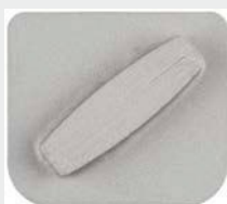
Enojni segment, S-Line, ETX1 vpetje, granulacija 16#