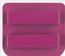
Dvojni segment, C-Line, ETX1 vpetje, granulacija 40# + HM grit (3-5 mm)