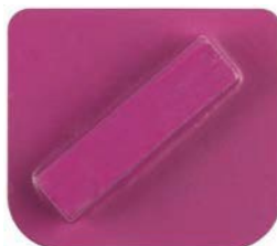
Enojni segment, C-Line, ETX1 vpetje, granulacija 40# + HM grit (3-5 mm)