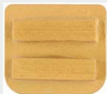
Dvojni segment, M-Line, ETX1 vpetje, granulacija 25#