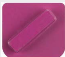
Enojni segment, C-Line, ETX1 vpetje, granulacija 40# + HM grit (3-5 mm)