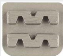
Dvojni segment, H-Line, ETX1 vpetje, granulacija 40#