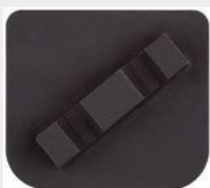
Enojni segment, X-Line, ETX1 vpetje, granulacija 150#