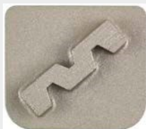
Enojni segment, H-Line, ETX1 vpetje, granulacija 40#