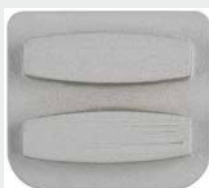
Dvojni segment, S-Line, ETX1 vpetje, granulacija 16#