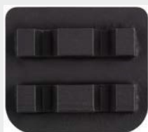
Dvojni segment, X-Line, ETX1 vpetje, granulacija 150#