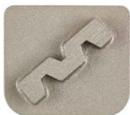
Enojni segment, H-Line, ETX1 vpetje, granulacija 40#

Orodja za brušenje tal za obdelavo betona so na voljo v obliki enojnih- ali dvojnih segmentov. Slednji imajo daljšo življenjsko dobo.