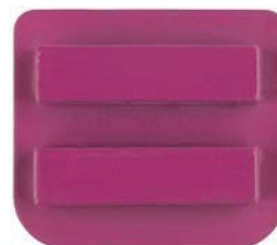
Dvojni segment, C-Line, ETX1 vpetje, granulacija 40# + HM grit (3-5 mm)