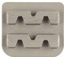
Enojni segment, H-Line, ETX1 vpetje, granulacija 40#