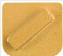
Enojni segment, M-Line, ETX1 vpetje, granulacija 25#